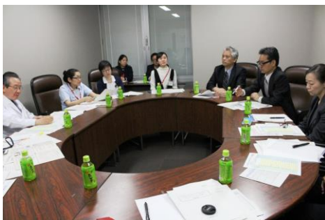
昨年の聖路加国際病院との意見交換会

7月6日(金)、駒込病院において「第12回東京都がん診療連携協議会 評価・改善部会」が開催されました。会議では、今年度も病院相互訪問を行うことが確認されました。訪問に当たっては、双方の病院で「PDCA」への取り組みについて確認を行うため、「チェックリスト」を使用することになりました。今年度の区東北部・東部ブロック訪問は下記のとおりです。